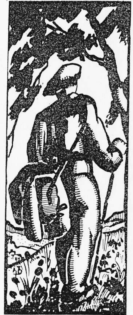
Dibuix de la Figura del Guia, fonamental per als Maquis.

Elements d'interès: 8 colls, 2 barraques, 1 cim, 1 castell, 1 refugi, 1 forn de calç, 1 mas.