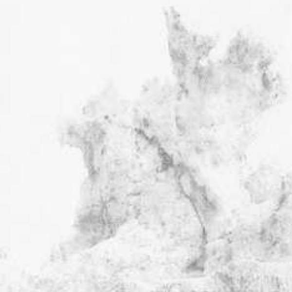
ALIGA DE TUDELA